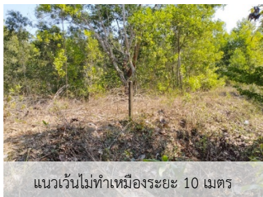
แนวเวนไม่ทำเหมืองระยะ 10 เมตร