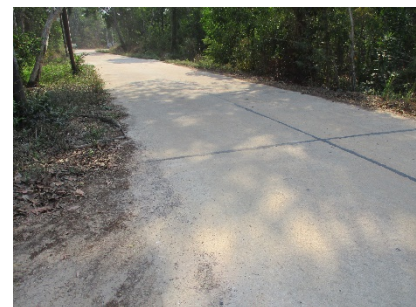
เส้นทางเข้าสู่พื้นที่โครงการ