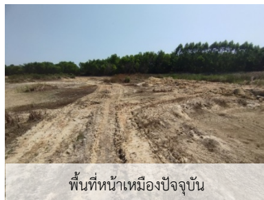
พื้นที่หน้าเหมืองปัจจุบัน