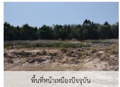
พื้นที่หน้าเหมืองปัจจุบัน