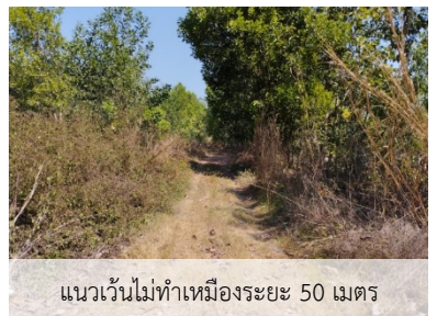
แนวเวนไม่ทำเหมืองระยะ 50 เมตร